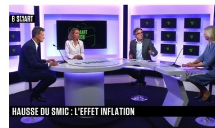
Commission - Communication